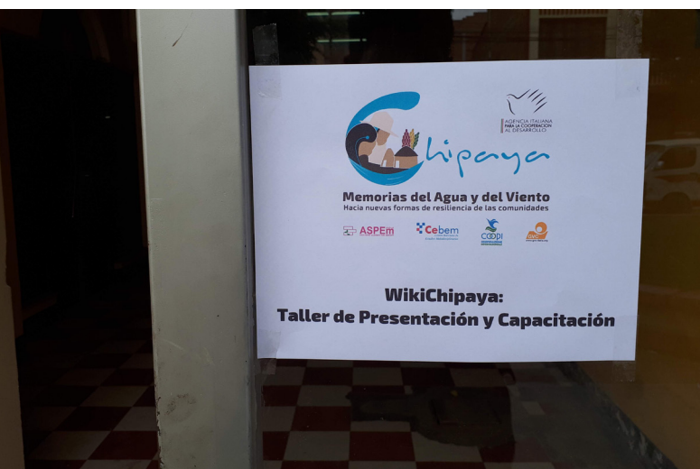
Entrada al taller de presentación de la enciclopedia y de capacitación para la elaboración de contenidos.

La generación de este tipo de experiencias se puede realizar a través de programas de uso libre, como WordPress, y disponiendo de tecnologías de código abierto que no generen costos en el futuro a los administradores del sistema. Por otro lado, se espera transferir la enciclopedia más adelante a una sección de la página web del Gobierno Autónomo Indígena Originario de Chipaya (GAIOC) con el fin de asegurar la continuidad de su disponibilidad una vez concluido el proyecto, y para que el manejo sea efectivo precisa de un sistema sencillo de utilizar y que no sea costoso.