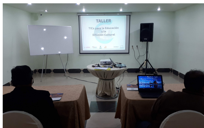
Taller TICs para la educación y difusión cultural donde se presenta la idea de la enciclopedia virtual. /Foto: Manuel Rebollo, 2019..