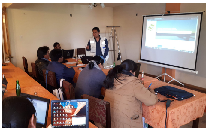
Taller de presentación de la enciclopedia y capacitaciones sobre su manejo. /Foto: Manuel Rebollo, 2020.